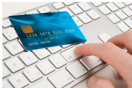
Obcokrajowiec nie może otworzyć w Polsce konta bankowego przez Internet.

Dzięki dzisiejszej mobilności Europejczyków, coraz więcej obcokrajowców decyduje się na pracę lub studia w Polsce. Nietrudno sobie wyobrazić, że dla cudzoziemca przebywającego dłużej poza granicami swojego kraju, posiadanie konta bankowego w kraju pobytu jest ogromnym ułatwieniem nie tylko ze względu na potrzebę wykonywania codziennych płatności, ale również możliwość przyspieszenia procesu otrzymywania wynagrodzenia.