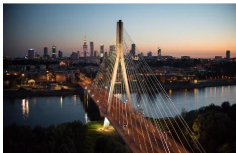
Warsaw – panoramic view

Do funkcjonujących już z powodzeniem departamentów, m.in. niemieckiego i włoskiego, dołączył Departament Polski.